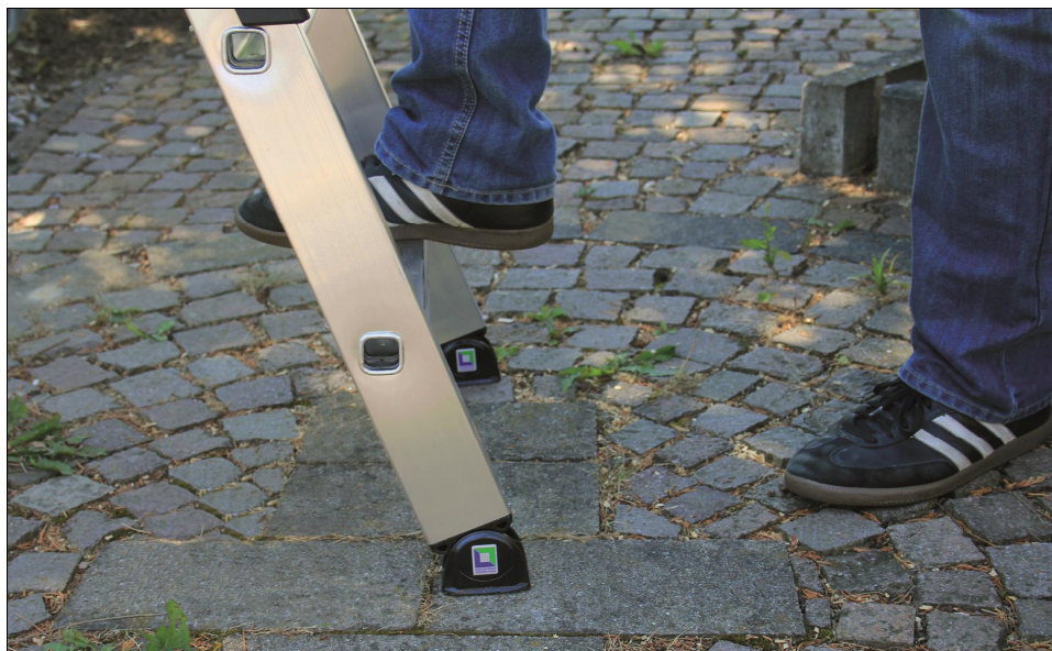
nivello®-Leiterschuhe gleichen sich durch ihre Beweglichkeit dem unebenen Kopfsteinpflaster an und sichern damit den Stand der Leiter.

Standstabilität des Nutzers vorteilhaft auswirkt. Daraus ergibt sich eine hohe Arbeitssicherheit und nachhaltig auch ein gesundheitlicher Mehrwert. Wer die Gewissheit hat, dass seine Leiter fest auf dem Untergrund steht und ihn sicher tragen kann, der kann sich und seinen Körper der Leiter anvertrauen. Das sichere und angstfreie Stehen auf der Leiter richtet den Rumpf ohne Verkrampfung auf. Das heißt, die tiefliegenden Rückenmuskeln stabilisieren reflektorisch die Wirbelsäule, während die oberflächlichen Muskeln bewusst eingesetzt werden, um Arme und Hände geschickt zu bewegen, sodass die Aufmerksamkeit gezielt auf die zu verrichtende Arbeit gelenkt werden kann. Das ausgewogene Spannungsverhältnis zwischen Halte- und Bewegungsmuskulatur ermöglicht ein ökonomisches Arbeiten. Muskulatur und Konzentration ermüden nicht so schnell.