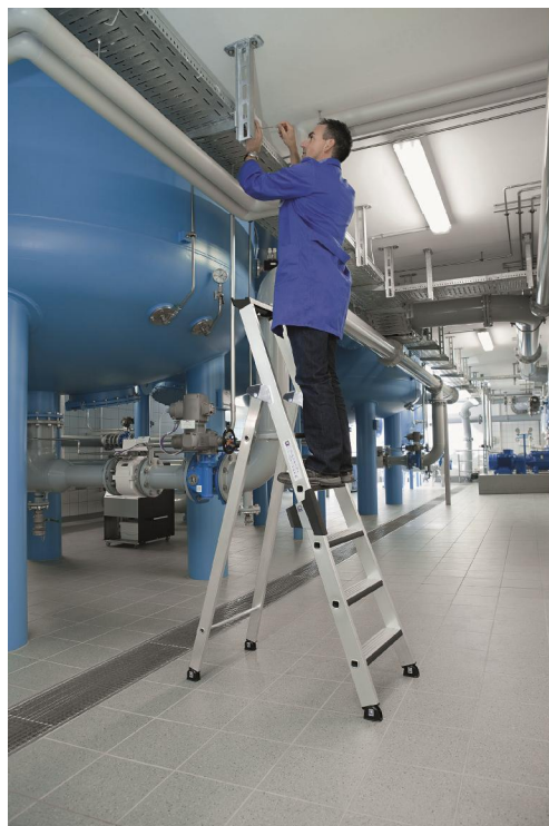
Relax-step ® - Stufenpolsterung

Der relax-step ® polstert den vorderen Rand der Leiterstufe ab. Das Polster besteht aus einer hochwertigen Gummimischung und ist an der Stoßkante der Stufe eingearbeitet. Vor allem Mitarbeiter in Kaufhäusern, Apotheken, Archiven oder Bibliotheken profitieren von der Stufenpolsterung, wenn sie frontal zum Regal länger stehend auf der Leiter Waren, Akten oder Bücher einsortieren. Sie können sich dabei bequem mit den Beinen an die Stufen lehnen. Die Druckbelastung durch das Anlehnen wird durch das Gummipolster gut abgepuffert, sodass besonders die empfindliche Knochenhaut an den Schienbeinen geschützt werden kann. Ein entspanntes aber doch sicheres Stehen erleichtert das Arbeiten auf der Leiter sehr.